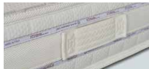
FASCIA TRASPIRANTE IN AIR-MESH 3D E MANIGLIA RINFORZATA