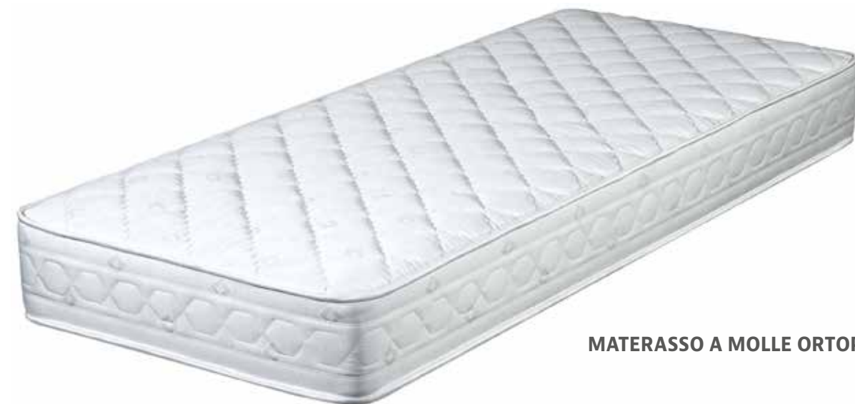
MATERASSO A MOLLE ORTOPEDICO BOXATO H 20