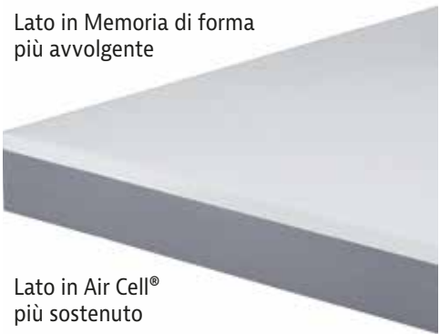
Lato in Air Cell® più sostenuto