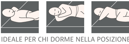
Lato in Memoria di forma più avvolgente

H 22 Cod. 54 – Green First Creata per combattere fenomeni allergizzanti: grazie all'imbottitura in fibre anallergiche e al trattamento permanente 100% naturale Green First (a base di geraniolo) tiene lontani acari e cimici; impedisce per anni la proliferazione di agenti allergizzanti con la sua funzione antibatterica e antimicotica.