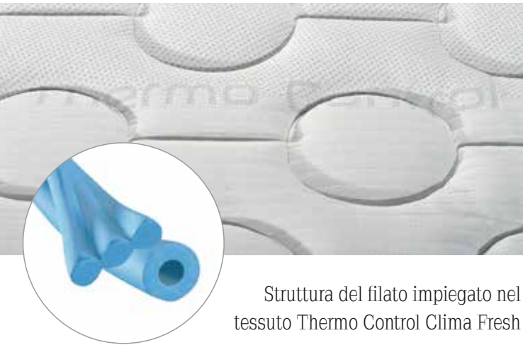
Struttura del filato impiegato nel tessuto Thermo Control Clima Fresh

Per incrementare ulteriormente l'efficacia del pannello, l'imbottitura è in puro lino certificato Master of Linen . Per assicurare un'ulteriore circolazione dell'aria, sotto l'imbottitura è presente un pannello in Air Mesh 3D .