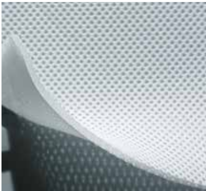
PARTICOLARE DEL PANNELLO VOLUMETRICO AIR MESH 3D® TRIDIMENSIONALE