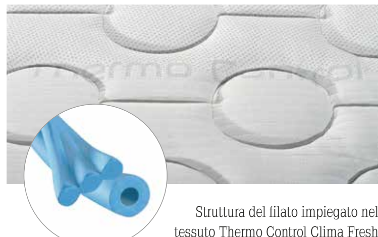
Struttura del filato impiegato nel tessuto Thermo Control Klima Fresh

Per assicurare un'ulteriore circolazione dell'aria, sotto l'imbottitura è presente un pannello in Air Mesh 3D .