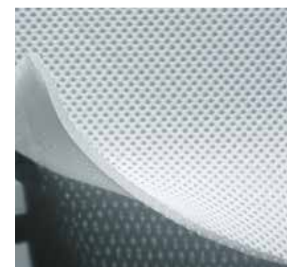
PARTICOLARE DEL PANNELLO VOLUMETRICO AIR MESH 3D® TRIDIMENSIONALE

* Esempio fuori misura modello base cm 110x200 = 22.000x0,0197 = Totale euro 433,40. I modelli inferiori a cm 80x190 saranno calcolati prezzo misura 80x190 + 15%.